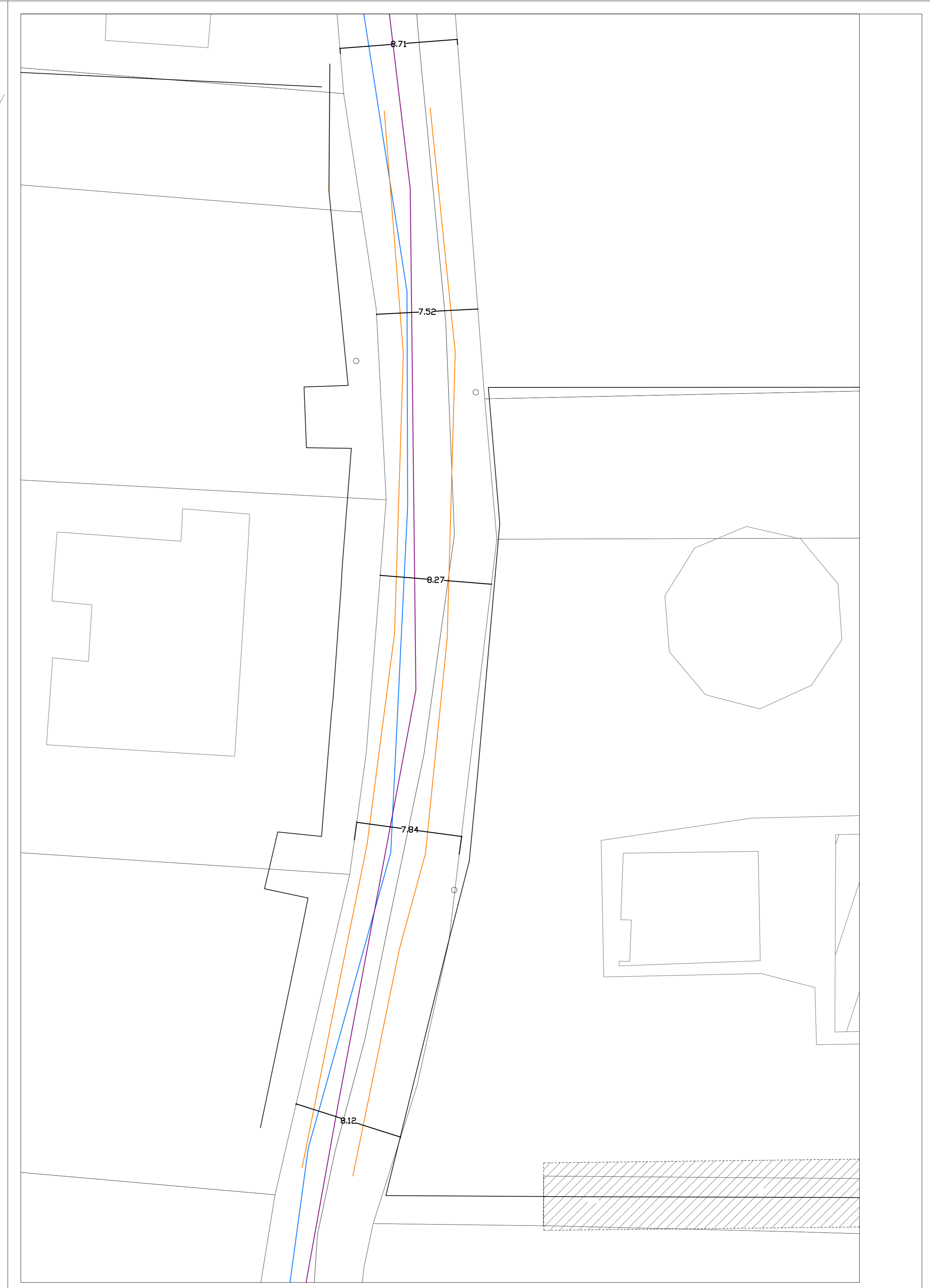
PLANIMETRIA RETE SOTTOSERVIZI scala 1:200