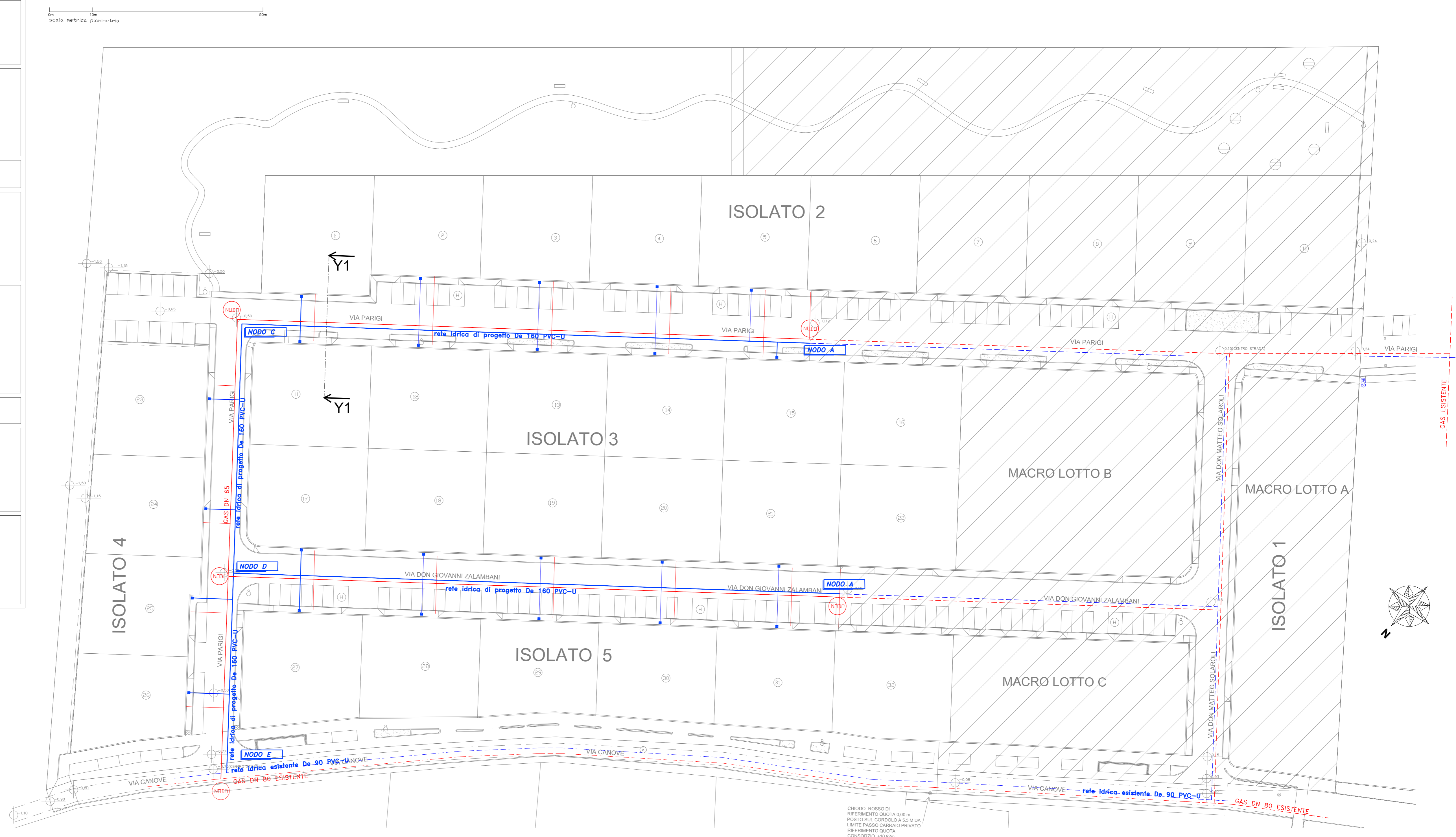
Planimetria reti gas e acqua scala 1:500